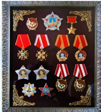
Награды и бюст маршала Толбухина Ф. И.