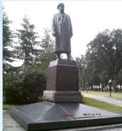
Памятник Маршалу Толбухину Ф.И. в Москве