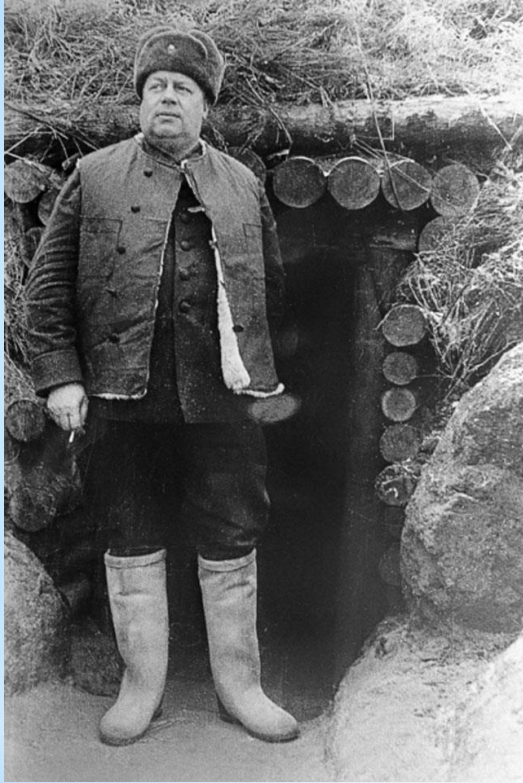
Командующий 57-й армией генерал Толбухин

С мая 1942 г. по февраль 1943 г. Ф. И. Толбухин участвовал в Сталинградской эпопее – весной 1942 г. в должности заместителя командующего войсками Сталинградского военного округа, а с июля 1942 года в должности командующего 57-й армией, которая остановила на южных подступах к Сталинграду 4-ю танковую армию вермахта, повернутую немцами с Кавказского на Сталинградское направление.