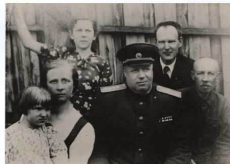
Ф. И. Толбухин среди родственников в городе Рыбинске. 1940-е гг.