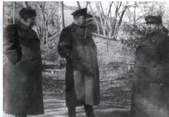
Член Военного совета Сталинградского фронта Н.С.Хрущев, начальник Генерального штаба А. М. Василевский, командующий 57-армией Ф. И. Толбухин . Сентябрь 1942 г.

После тяжелейших оборонительных боев силы армии были сохранены, и с началом общего контрнаступления под Сталинградом 57-я армия успешно выполнила задачи по окружению, расчленению и уничтожению группировки противника.