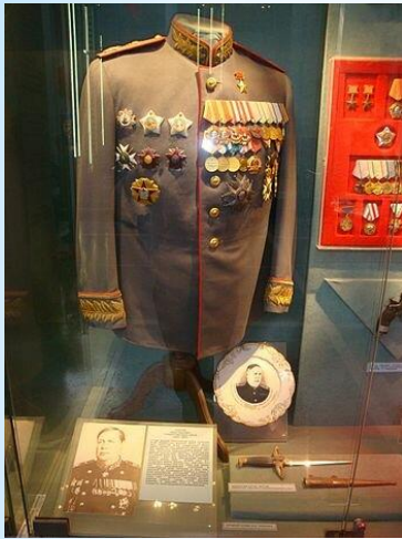
Парадный китель маршала Толбухина с наградами в Центральном музее Вооружённых Сил в Москве