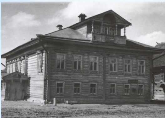
Дом. В котором родился маршал Советского Союза Ф.И.Толбухин в деревне Андроники Давыдовского района Ярославской области.