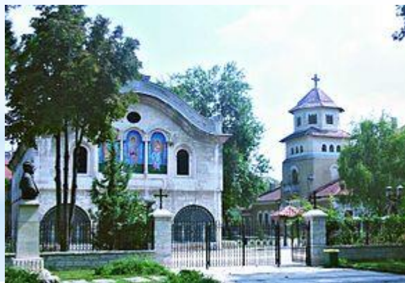
Город Добрич. Болгария