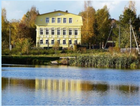
Историко-музейный комплекс «Толбухино»