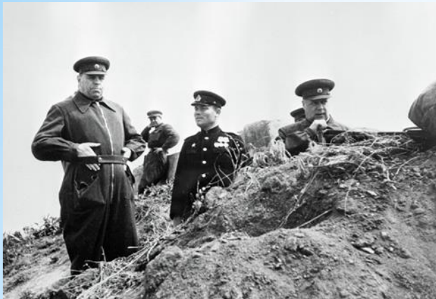
Ф. И. Толбухин и А. М. Василевский на командном пункте под Севастополем. Май 1944 г.