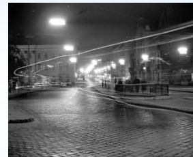
Будапешт, 1969. Этот центральный проспект венгерской столицы тогда носил имя нашего маршала.