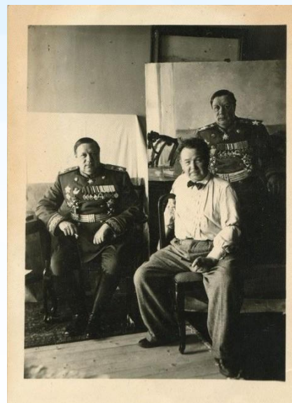
В мастерской художника А.М. Герасимова в Румынии Кармен-Сильве. 1945 г.