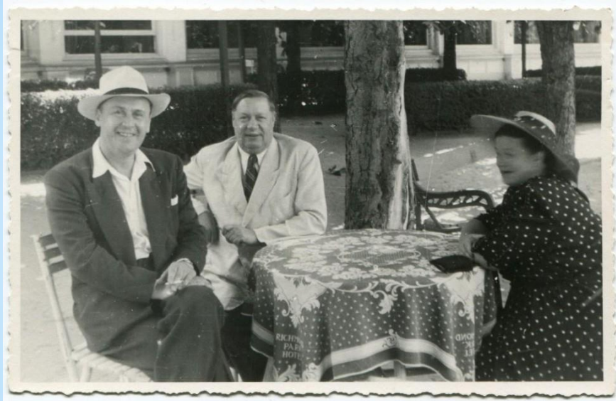
Ф.И. Толбухин с женой и народным аристом РСФСР Б.Н.Лиановым в санатории Карловы Вары.